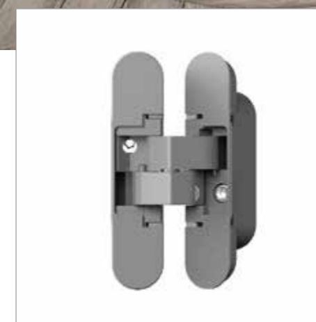
CERNIERA A SCOMPARSA REGOLABILE